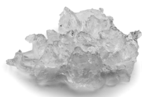
MF 26 Flockeneisbereiter Restwassergehalt 25%