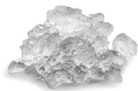
MF 58 Superflocke Restwassergehalt 15%